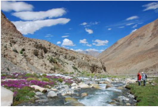
ความงดงามระหว่างทาง