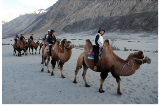
ขี่อูฐสองหนอก ที่ sand dune

ช่วงบ่าย- เดินทางถึง นุบราวัลเลย์ เข้าสู่ที่พัก เก็บของพักเหนื่อย พอดีตรงๆไปเที่ยวที่ เนินทราย Sand Dunes ไปดูอูฐ 2 หนอก (Bactrian camels) ที่หลงเหลือมาจากสมัยที่ขบวนคาราวานยังผ่านไปมาในเส้นทางสายไหม Trans-Karakoram อันเก่าแก่ ทุกวันนี้อูฐทำงานรับจ้างบริการนักท่องเที่ยว แทนอาชีพคาราวานดั้งเดิม เราจะ ขี่อูฐ เดินเล่นบนผืนทะเลทรายกัน *ค่าอูฐ และค่าทิปให้คนจูงอูฐ ไม่รวมอยู่ในค่าทัวร์ ต่างคนต่างจ่ายกันตรงนั้น เพื่อเงินค่าอูฐและทิป ประมาณ 500-600 รูปี เย็นถึงค่ำ- แวะไปเที่ยวเดินตลาดเล็กๆในหมู่บ้าน แล้วกลับเข้าสู่ที่พัก กินอาหารเย็น คืนนี้หลับสบายกันที่ นุบราวัลเลย์