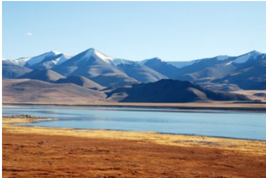
ทะเลสาบโซการ์ ในเดือนตุลาคม

ทะเลสาบงดงาม อยู่สูงกว่าระดับน้ำทะเล 4,530 เมตร (14,860 ฟุต) เป็นทะเลสาบน้ำเค็ม อยู่บนที่ราบสูง Rupshu ทางตอนใต้ของลาดักห์ ในรัฐจัมมูและแคชเมียร์ ปัจจุบันชาวเผ่าเร่ร่อน Changpa ใช้น้ำในทะเลสาบมาผลิตเป็นเกลือ ส่งออกไปยังทิเบต บริเวณนี้มีความผันผวนทางสภาพอากาศมาก ในฤดูหนาวอาจหนาวเย็นได้ถึง -40 องศา และอาจสูงถึง 30 องศา ในฤดูร้อน ฝนแทบไม่ตกเคยมีในพื้นที่แถบนี้