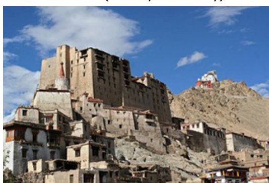
พระราชวังเลห์ (Leh Palace)