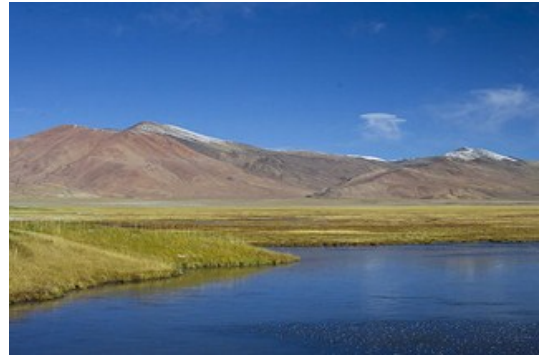
ทะเลสาบโซการ์ ในเดือนสิงหาคม

ถ่ายรูปดื่มด่ำกับธรรมชาติ และปรับตัวให้เข้ากับพื้นที่สูง พักผ่อนเหนื่อยแล้วออกเดินทางต่อสู่ ทะเลสาบโซการ์ (Tsokar Lake) *ระยะทางประมาณ 140 กิโลเมตร นั่งรถนาน 4-5 ชั่วโมง บ่ายถึงเย็น- เข้าสู่แคมป์ที่พัก พักผ่อนตามสบาย ช่วงค่ำ- กินอาหารเย็น คืนนี้พยายามหลับให้ได้ ริมทะเลสาบแสนงาม