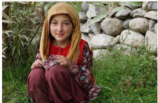
เด็กน้อยที่ Turtuk Village