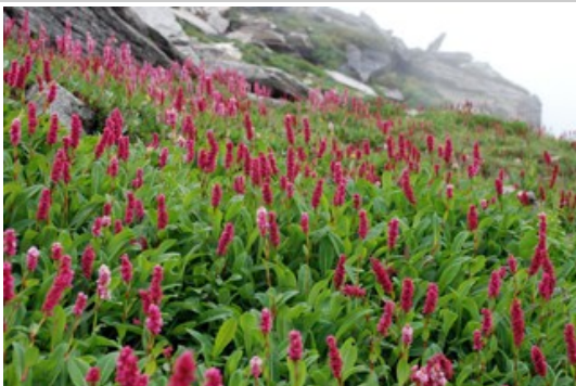
ดอกไม้ข้างทาง ปลายฤดูฝน