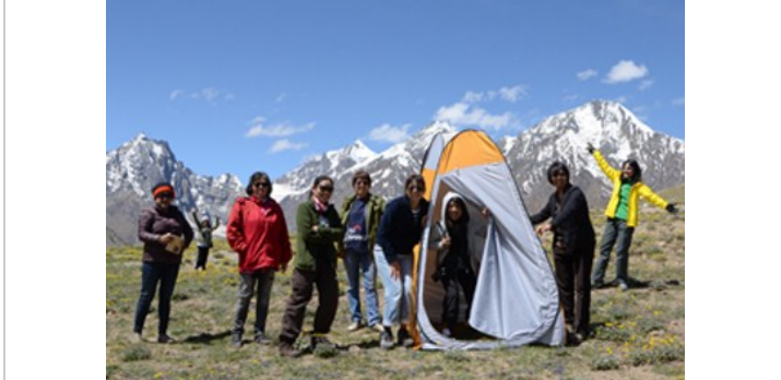
เต็นท์ห้องน้ำของเรา ปวดฉี่จอดได้ทันที