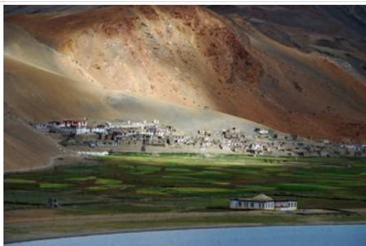
ขึ้นไปชมทะเลสาบในมุมสูง ยามเช้า