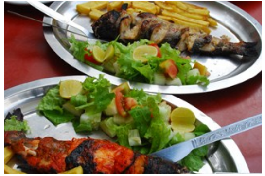
ปลาเทราต์สดๆจากแม่น้ำ Beas River

เที่ยง- กินอาหารกลางวัน ช่วงบ่าย- เทียว เมืองมะนาลี เน้นการเดินเที่ยว เดินปรับสภาพร่างกาย เหนื่อยกันหน่อย แต่ก็ต้องเดิน เพื่อวันพรุ่งนี้ที่ดีกว่า เย็นถึงค่ำ- กินอาหารเย็น จากนั้นพักผ่อน เก็บแรงไว้เดินทางในวันรุ่งขึ้น