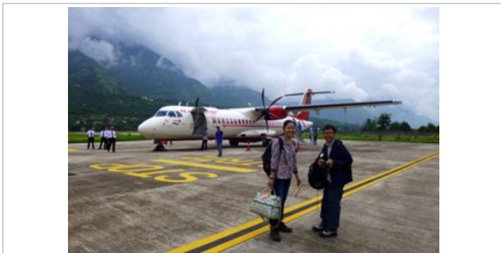
นั่งเครื่องสู่เมืองคุรุ (Bhuntar Airport)

04.00 น. ตื่นเข้าไปสนามบิน เช็किनโหลดกระเป๋า กินอาหารเช้า *ต่างคนต่างกินที่สนามบิน ค่าอาหารไม่รวมอยู่ในค่าทัวร์ 06.30 น. ได้เวลาเครื่องออก เดินทางสู่สนามบินคุรุ (Bhuntar Airport) *ใช้เวลาเดินทางประมาณ 1 ชั่วโมง 20 นาที 07.50 น. เดินทางถึงเมืองคุรุ รถมารับที่สนามบิน แวะเที่ยวเมืองคุรุ กันสักนิด แล้วเดินทางเข้าสู่เมืองมะนาลี *ระยะทางประมาณ 40 กิโลเมตร นั่งรถนาน ประมาณ 1 ชั่วโมง