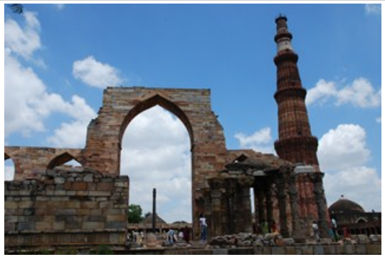
เที่ยว กุตุป มินาร์ (Tower of Victory)

กินอาหารกลางวันที่ร้านอาหาร *อาหารไทย Ego Thai Restaurant อิ่มแล้วพาไป Shopping ที่ตลาด Khan Market ร้านเสื้อผ้าก๊ิบเก้ Anokhi Shop บ่าย- แวะเที่ยว กุตุป มินาร์ (Tower of Victory) หอคอยแห่งชัยชนะ สูง 72.50 เมตร สัญลักษณ์ของกรุงนิวเดลี เย็นถึงค่ำ - เข้าสู่โรงแรมที่พัก กินอาหารค่ำที่ห้องอาหารของโรงแรม แล้วรีบเข้านอนเก็บแรงไว้เดินทางในวันรุ่งขึ้น