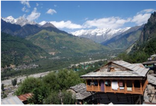
วิวสวยๆของมะนาลี