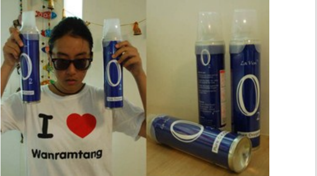
O2 ออกซิเจน มีพร้อมให้ทุกคน