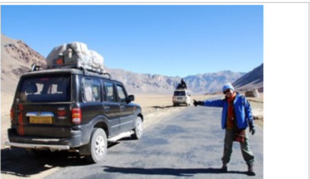
รถที่ใช้ตลอดการเดินทาง