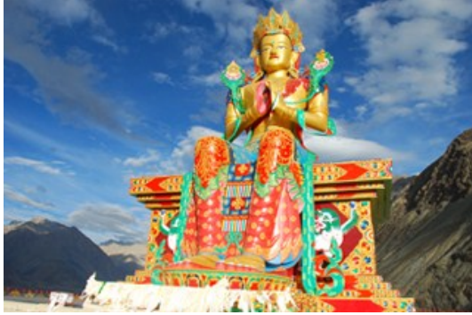
พระศรีอารยเมตไตรย์ วัด Diskit

เป็นหมู่บ้านสุดท้ายชายแดนอินเดีย ติดเขตแดนปากีสถาน ตั้งอยู่บนฝั่งแม่น้ำ Shyok ในหุบเขานูบรา (Nubra Valley) ห่างจากเมืองเลห์ ประมาณ 205 กม. ที่นี่ได้ชื่อว่าเป็นประตูสู่ธารน้ำแข็ง Siachen Glacier ชาวบ้านส่วนใหญ่ที่อาศัยอยู่ในหมู่บ้านเป็นชาวมุสลิม พูดภาษา Baltistani ภาษาอูรดู และภาษาลาดักห์ หมู่บ้าน Turtuk อยู่ภายใต้การปกครองของปากีสถาน ตั้งแต่เมื่อครั้งที่อินเดียและ ปากีสถานได้รับเอกราชจากอังกฤษ จนกระทั่งในช่วงสงครามอินโด-ปากีสถาน ในปี ค.ศ. 1971 อินเดียจึงได้ควบคุมพื้นที่ยุทธศาสตร์แห่งนี้ ทั้งสองประเทศมีความขัดแย้งรุนแรงอีกครั้งเหนือพื้นที่บริเวณนี้ในปี ค.ศ. 1999 ในระหว่างสงครามการกิล (Kargil War) จึงไม่แปลกที่ระหว่างสองข้างทาง เราจะพบอนุสาวรีย์เล็กๆ ที่สร้างขึ้นเพื่อรำลึกถึงทหารผู้กล้าที่สละชีวิตจากสงครามด้วยทัศนียภาพของหุบเขาที่สวยงาม หมู่บ้านแห่งนี้เพิ่งเปิดให้นักท่องเที่ยวเดินทางเข้ามาเยือนได้ในปี ค.ศ. 2010 แม้ว่าจะเป็นหมู่บ้านของชาวมุสลิม แต่ก็พอมิวัดเก่าแก่ในศาสนาพุทธให้เห็นอยู่บ้าง