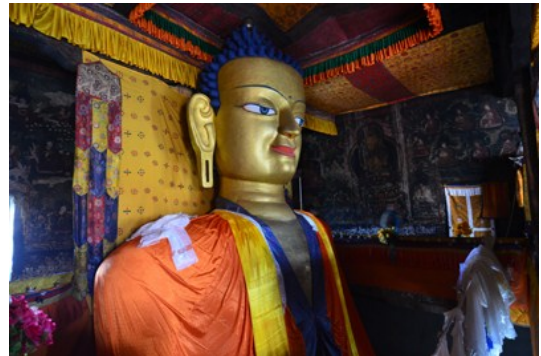
องค์พระศากยมุนี ภายในพระราชวังเชย์