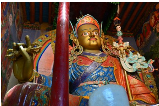
องค์ครูปัทมสัมภาะ ภายในวัดเฮมิส