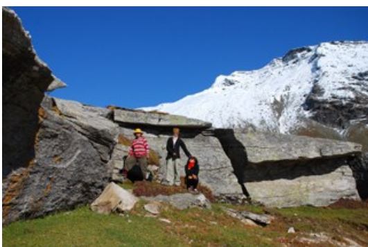
ระหว่างเส้นทาง จากมะนาลี - จิสปา