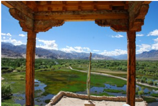
วิวด้านหน้าพระราชวังเชย์ (Shey Palace)

ตื่นเช้า- กินอาหารเช้า แล้วไปเที่ยวสบายๆในเมืองเลห์ เริ่มที่ พระราชวังเชย์ (Shey Palace) ดอนแสงสวยๆ แล้วไปต่อที่ วัดเฮมิส (Hemis monastery)