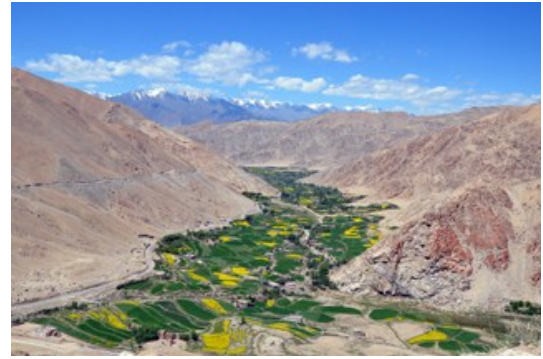
ก่อนกลับเข้าเมืองเลห์

ตื่นเช้า- กินอาหารเช้ากัน วันนี้เราจะกลับเมืองเลห์ ใช้เส้นทางที่ผ่าน ขางลา (Chang La Pass) ถนนซึ่งสูงเป็นอันดับ 3 ของโลก *ระยะทางถึงเลห์ประมาณ 200 ก.ม. ใช้เวลาเดินทาง 5-6 ชั่วโมง เที่ยง- กลับถึงเมืองเลห์ กินอาหารกลางวัน แล้วเข้าสู่ที่พัก ช่วงบ่าย- ให้เวลาตามอัธยาศัย Shopping ตามสะดวก ช่วงค่ำ- Special Dinner กินอาหารเย็นพร้อมกันที่ร้านอาหารอร่อยๆ คืนนี้หลับสบายกันที่เลห์