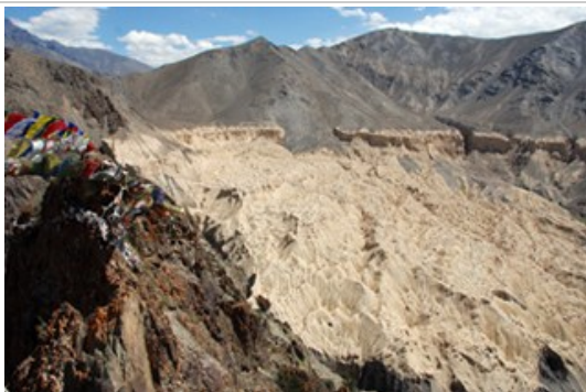
Moon Land หุบเขาโลกพระจันทร์

วัดลามายูรุ (Lamayuru Gompa) วิหารของวัดตั้งอยู่บนยอดเขาสูงแวดล้อมด้วยเทือกเขาขนาดใหญ่ ภายในวัดมีถ้ำเล็กๆ ซึ่งประดิษฐานประติมากรรมรูปลามะองค์สำคัญได้แก่ท่านมอราปะ ผู้ก่อตั้งนิกาย Kagyupa ซึ่งเชื่อกันว่าท่านเคยมาปฏิบัติสมาธิภาวนาในถ้ำแห่งนี้