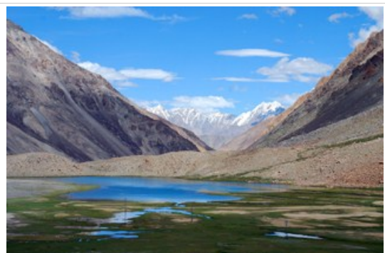
ความงดงามระหว่างทาง