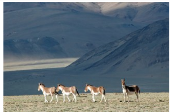
ระหว่างทางกลับเลห์มองหา ลาป่า (Wild Ass)

ตื่นเช้า - กินอาหารเช้า แล้วเดินเที่ยวชมบรรยากาศสบายๆริมทะเลสาบ อย่าลืมว่าที่ตรงนี้สูงมาก เดินช้าๆ กินช้าๆ ดื่มน้ำเยอะๆไม่ต้องกลัวน้ำหมด ออกเดินทางสู่ เมืองเลห์ (Leh)