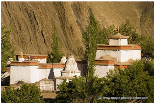
วัดอัลชี (Alchi Gompa)

ยังมีความสำคัญในด้านประวัติศาสตร์ คือ หลังจากการสิ้นพระชนม์ของดาไลลามะองค์ที่ 5 แห่งทิเบต ผู้สำเร็จราชการแทนพระองค์ ได้ส่งคณะทูตนำโดย สังฆราชา แห่งนิกายดรุคปะ (Drukpa) มาที่ Tingmosgang ในปี ค.ศ. 1684 และได้มีการเขียนลงนามภายใต้ สนธิสัญญา Tingmosgang ระหว่างราชอาณาจักรทิเบตและลาดักห์ ในประเด็นเขตแดนระหว่างสองราชอาณาจักร ขอดกกลงทางศาสนาและการค้า ที่ยังคงยึดถือมาจนถึงปัจจุบัน