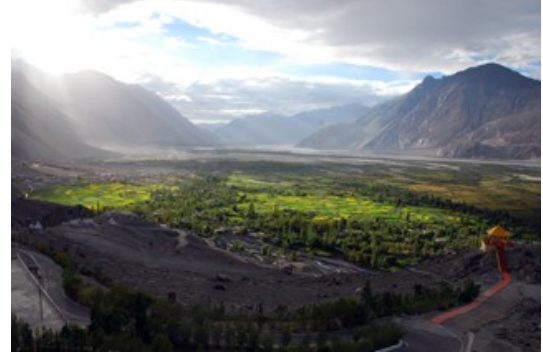
นูบราวัลเลย์ (Nubra Valley)