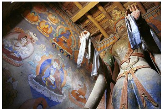
พระโพธิสัตว์ ภายในวัดอัลชี