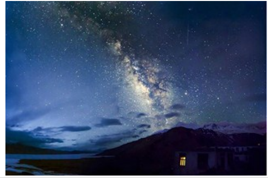
ทางช้างเผือกในคืนเดือนมืด

ตื่นเช้า - กินอาหารเช้า แล้วเดินเที่ยวชมบรรยากาศสบายๆริมทะเลสาบ อย่าลืมว่าที่ตรงนี้สูงมาก เดินช้าๆ กินช้าๆ ดื่มน้ำเยอะๆไม่ต้องกลัวน้ำหมด ออกเดินทางสู่ ทะเลสาบโซโมริริ (Tsomoriri Lake)