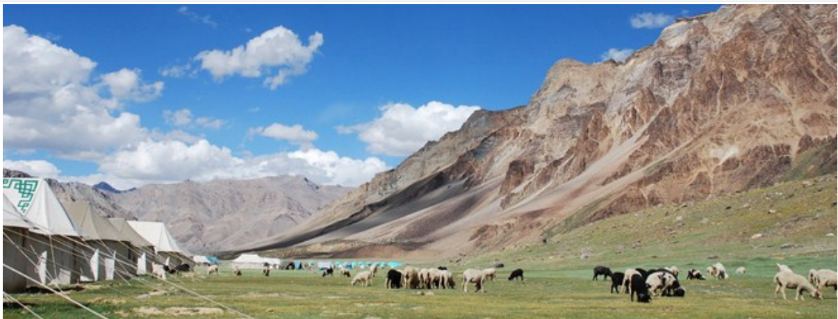
แคมป์ที่ซาร์ชู (Sarchu Camp)

เป็นทุ่งราบท่ามกลางหุบเขา อยู่สูงกว่าระดับน้ำทะเล 4,290 เมตร (14,070 ฟุต) การเดินทางจากมะนาสิถึงเลห์ ต้องขับรถไปตามทางหลวง มะนาสิ-เลห์ (Manali-Leh Highway) แต่ด้วยระดับความสูงและสภาพถนนที่ไม่ดีนัก การเดินทางระหว่างสองเมืองนี้ จึงต้องใช้เวลาราว 2 วัน ซาร์ชู (Sarchu) เป็นจุดที่ตั้งอยู่ระหว่างรัฐหิมาจัลประเทศและรัฐจัมมูและแคชเมียร์ ผู้ที่ต้องเดินทางไปมาระหว่างสองเมือง จึงนิยมแวะพักกันที่นี่ เส้นทางนี้ รวมถึงแคมป์ที่พัก จะปิดลงในฤดูหนาวที่หิมะท่วมสูงจนรถไม่สามารถวิ่งได้