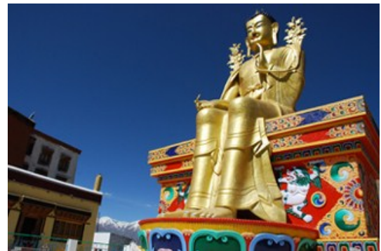
วัดลิคิรี (Likir Gompa)