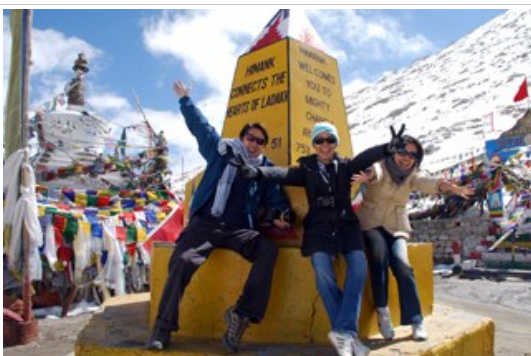
ขางลา (Chang la Pass)