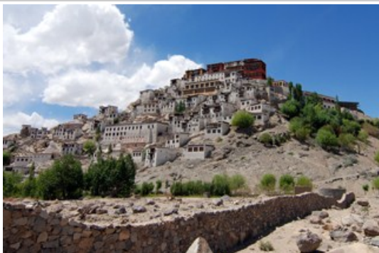
วัดธิคเซย์ (Thiksey Monastery)

สร้างตั้งแต่ปี ค.ศ.1430 ภายในประดิษฐานพระพุทธรูปขนาดใหญ่ และพระคัมภีร์เก่าแก่จากทิเบต บริเวณเหนือตัววัดจะเป็นป้อมปราการเก่า เป็นจุดชมวิวที่สามารถเห็นเมืองเลห์ได้อย่างสวยงาม