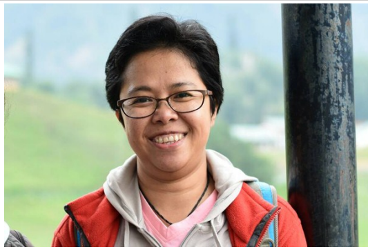
ปลา' Tour Leader พาเที่ยว

06.00 น. พบกันที่สนามบินสุวรรณภูมิ เมื่อทุกท่านมาพร้อม ทีมงานจะพาไปที่เคาน์เตอร์สายการบิน เพื่อเช็คอินบัตรโดยสารและโหลดสัมภาระ *สามารถโหลดกระเป๋าได้หนักไม่เกิน 20 กิโลกรัม เช็คอินเสร็จแล้ว แยกย้ายกันเข้าด้านใน ผ่าน ตม. รอขึ้นเครื่องพร้อมกัน 08.50 น. ใต้เวลาเครื่องออก เดินทางสู่ประเทศอินเดีย ใช้เวลาเดินทางประมาณ 4 ชั่วโมง *กินอาหารเข้าบนเครื่องบิน 12.05 น. ถึงแผ่นดินอินเดีย ผ่านพิธีการตรวจคนเข้าเมืองและศุลกากร