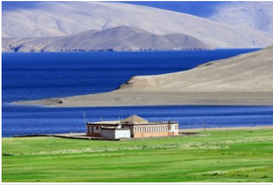
ถึงแล้วทะเลสาบโมริริ (Tsomoriri Lake)