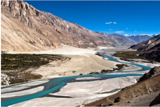
แม่น้ำ Shyok River

มีความยาวถึง 40 ไมล์ กว้าง 2-4 ไมล์ พื้นที่ 75% ของทะเลสาบอยู่ในดินแดนทิเบต อีก 25% อยู่ในเขตของอินเดีย เป็นทะเลสาบน้ำเค็มที่อยู่สูงที่สุดในโลก คือ 4,350 เมตร (14,270 ฟุต) จากระดับน้ำทะเล ทะเลสาบที่มีภูเขาสูงเป็นฉากหลัง น้ำในทะเลสาบแห่งนี้มีสีสีนทั้งดงามมาก โดยเฉพาะในช่วงเย็นน้ำจะมีสีน้ำเงินเข้ม งดงามจับใจ