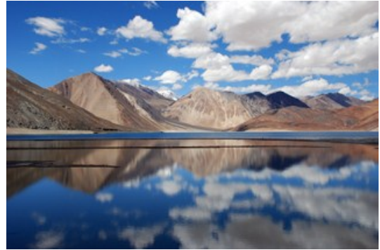
ทะเลสาบพันกอง (Pangong Lake)

บายถึงเย็น- เข้าสู่แคมป์ที่พัก พักผ่อนตามสบาย ถ่ายรูป ต้มตำกับความงามของทะเลสาบ ชื่นชมธรรมชาติกันเต็มที่ ช่วงค่ำ- กินอาหารค่ำ คืนนี้หลับให้สบายริมทะเลสาบแสนงาม