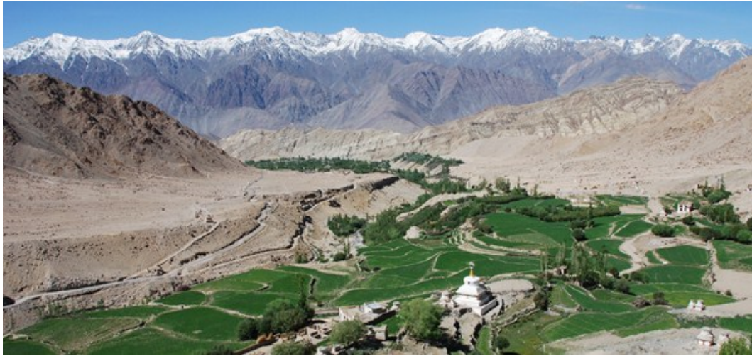
วิวจากวัดลิคิรี (View from Likir Gompa)

แห่งหมู่บ้านบาสโก ชมชนเล็ก ๆ ก่อนเข้าถึง หมู่บ้านอัลซี บาสโกมีชื่อเสียงเพราะ UNESCO Asia-Pacific Heritage ภายในมีวัดและพระพุทธรูปพระศรีอาริยมตไตรย์ ขนาดใหญ่ที่ปั้นด้วยดินเหนียว เก้าแก่และงดงามมากองค์หนึ่ง