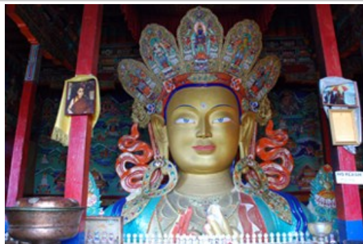
พระศรีอารยะเมตไตรย์ วัดธิคเซย์