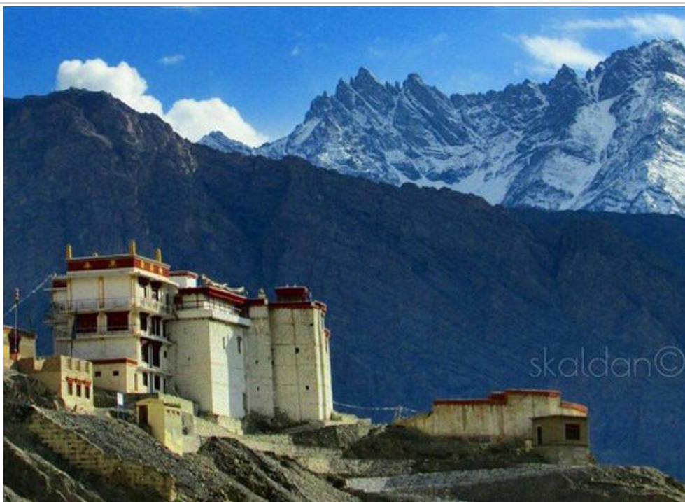
พระราชวัง Tingmosgang และ วัด Tingmosgang Gompa

ตั้งอยู่ริมฝั่งแม่น้ำสินธุ แต่เดิมที่นี่เคยเป็นเมืองหลวงโบราณของ ราชอาณาจักรแซม (Syham Kingdom) บนเนินเขาเป็นที่ตั้งของ ปราสาท Tingmosgang Castle และ วัด Tingmosgang Gompa Tingmosgang สร้างขึ้นโดยกษัตริย์ Drag-pa-Bum ในศตวรรษที่ 15 ต่อมาภายหลังกษัตริย์ Bagan ซึ่งคือหลานปู่ของ Drag-pa-Bum ได้ขยายอาณาจักรจนถึงใหญ่ และเป็นผู้ก่อกำเนิดราชวงศ์นัมเกล (Namgyal Dynasty) อันมีความหมายว่า ชัยชนะ ราชวงศ์นัมเกล นับได้ว่าเป็นราชวงศ์ที่สองของลาดักห์ ที่มีอำนาจทางการปกครองมากในสมัยนั้น เชื้อสายของราชวงศ์นี้ปัจจุบันยังคงอาศัยอยู่ที่ พระราชวังสต็อก (Stok Palace) ไม่ไกลจากเมืองเลห์