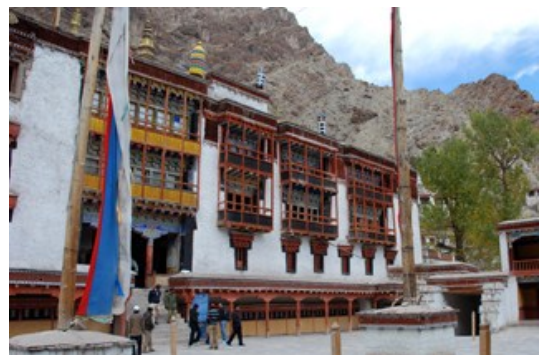
วัดเฮมิส (Hemis Monastery)