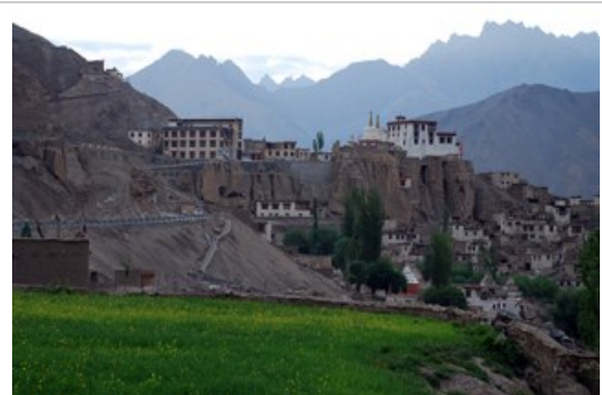
Lamayuru Gompa วัดลามายูรุ